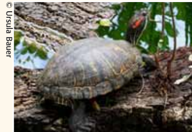
Ausgesetzte Rotwangen-Schmuckschildkröte in einem öffentlichen Park.

sehbare Folgen für unsere heimische Tierwelt. Rotwangen-Schmuckschildkröten beispielsweise, die als Jungtier mit 5 cm Panzerlänge für ein paar Euro im Internet zu haben sind, wachsen in kurzer Zeit auf über 20 cm Länge heran. Diese Wasserschildkröten werden derart häufig einfach am nächsten Teich ausgesetzt, dass sie in unseren Großstädten bereits an fast jedem Gewässer zu finden sind und zum weiteren Rückgang unserer bedrohten heimischen Sumpfschildkröte führen.