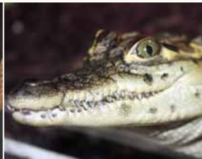
Das Rautenkrokodil (Crocodylus rhombifer) steht kurz vor der Ausrottung und ist streng geschützt.

sive deren Kreuzungen wie etwa American Staffordshire-Terrier, Bullterrier oder Pitbull, dürfen gar nicht nach Deutschland verbracht werden. Für hunderte fremdländische Tierarten gelten außerdem umfangreiche internationale und nationale Tier-, Natur- und Artenschutzvorschriften wie beispielsweise das Washingtoner Artenschutzübereinkommen (CITES), das EU-Artenschutzabkommen, die Bundesartenschutzverordnung und das Bundesnaturschutzgesetz. Ungeachtet dieser gesetzlichen Bestimmungen werden tausende Tiere nach Deutschland geschmuggelt und dann völlig unkontrolliert vorrangig über das Internet an den Mann gebracht. Der lukrative Schwarzmarkt boomt, und die Händler schrecken auch nicht vor gefälschten Herkunftspapieren zurück.