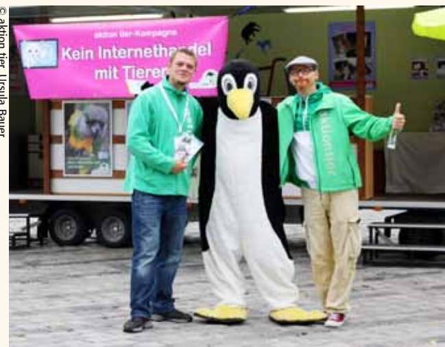
aktion tier startete 2015 eine Aufklärungskampagne in Nürnberg mit umfassenden Informationen zum Thema „Kein Internethandel mit Tieren“.

Die Entwicklung des Internet vollzieht sich mit rasender Geschwindigkeit. Unsere nationalen oder europaweiten Gesetze kommen da schon lange nicht mehr hinterher. Der Internetzug ist längst abgefahren – ohne Kontrolleure an Bord. Jeder, der über eine Emailadresse verfügt, kann ein Tierverkaufs-Inserat schalten, ohne seine wahre Identität preisgeben zu müssen. Es ist schier unmöglich, kriminelle Machenschaften zu entdecken und zu ahnden. Der Inserate-Dschungel im Netz ist derart durchseucht mit unseriösen, illegalen und betrügerischen Verkaufsangeboten, dass wir ganz bewusst auf Tipps für den „sicheren“ Kauf eines lebenden Tieres im Internet verzichten. Wer der Meinung ist, ein Lebewesen wie ein Kleidungs- oder Möbelstück via Mausclick bestellen zu müssen, sollte sich darüber im Klaren sein, dass er den unkontrollierten Online-Handel, der aus Tierschutzsicht extrem problematisch und in großen Teilen skrupellos und kriminell ist, weiter ankurbelt. Die Gefahr ist groß, sich mitschuldig am Artensterben und großem Tierleid zu machen. Daher sagen wir: Kein Internethandel mit Tieren!