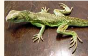
Kranke und halb verhungerte Wasseragame.