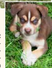
Der schöne Schein...

Die Gefahr, ein krankes Tier im Internet zu kaufen, ist sehr groß. Vor allem skrupellosen Massenvermehrern und profitorientierten Tierhändlern ist die Gesundheit ihrer „Ware“ egal. Die niedlichen Anzeigenfotos von munteren Hund- und Katzenbabys haben nichts mit der Realität zu tun, denn dahinter verbergen sich oft Hundewelpen mit tödlichen Infektionskrankheiten, Kätzchen mit Schnupfen oder Möpse mit chronischen Atemproblemen. Auch Reptilien werden häufig parasitenbefallen und krank zum Kauf angeboten. Diese Tiere leiden leise, und ein unerfahrener Halter wird kaum erkennen, wie schlecht es ihnen geht.