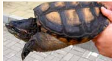
Für Schnappschildkröten gilt in Deutschland ein absolutes Besitz- und Vermarktungsverbot.

Ein weiteres großes Problem beim Internethandel ist das Fehlen einer Beratung, zum Beispiel zur artgerechten Haltung, zur Lebenserwartung und Endgröße der einzelnen Tiere. Es wird meist auch nicht hinterfragt, ob der Käufer über eine gewisse Sachkunde verfügt. Gerade bei Exoten führt dies häufig dazu, dass Tiere aufgrund der Unkenntnis ihrer neuen Besitzer elend vor sich hinvegetieren oder sterben. Oft sind die Halter auch nach kurzer Zeit überfordert, geben die Tiere weiter oder setzen sie einfach aus. Bei sogenannten invasiven exotischen Tierarten, die auch hierzulande in freier Wildbahn überleben, hat dies unvorher-