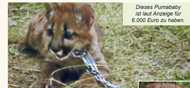
Dieses Pumbaby ist laut Anzeige für 6.000 Euro zu haben.

Der weltweite Online-Handel mit Waren, Produkten und Dienstleistungen wächst ständig und macht auch nicht vor lebenden Tieren halt. Im 'World Wide Web' werden nicht nur massenhaft Hunde, Katzen und Kaninchen, sondern auch fast jedes exotische Wildtier zum Kauf angeboten. Besonders problematisch ist der Inseratehandel, bei dem unter anderem Privatpersonen, Züchter und Tierhändler auf diversen Plattformen Verkaufsanzeigen meist kostenlos einstellen können. Doch der im Internet weitestgehend unkontrolliert mögliche internationale Handel mit lebenden Tieren ist in vielen Fällen tierschutzwidrig. Hinzu kommt, dass sich illegale oder betrügerische Angebote im Inserate-Dickicht kaum von seriösen Anzeigen unterscheiden lassen. Am Ende sind die Leidtragenden nicht nur die betroffenen Tiere, sondern oft auch die arglosen Käufer.