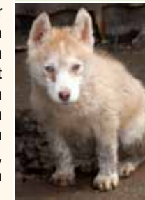
... und die Realität.