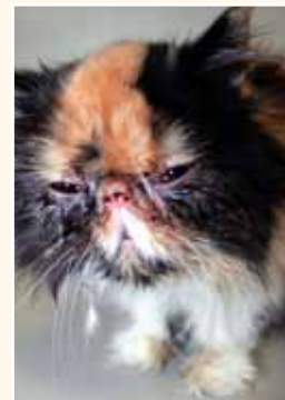
Sowohl der Verkauf als auch der Erwerb eines kranken Tieres ist verboten.

Was viele nicht wissen: Auch als Käufer macht man sich strafbar, wenn man gegen nationale oder internationale gesetzliche Bestimmungen verstößt. Sei es durch den Kauf eines artgeschützten Wildtieres ohne entsprechende Papiere, den Erwerb eines illegal importierten oder kranken Tieres, eines unter 8 Wochen alten Hundes oder durch die Anschaffung eines Hausgenossen, der nur mit spezieller Genehmigung in Deutschland gehalten werden darf.