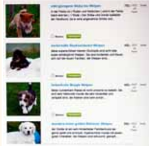
Ein Niederländer bietet zeitgleich Welpen von bis zu 17 Hunderassen an.

Mit dem Tierverkauf via Internet ist unglaublich viel Geld zu verdienen. Wir haben ein deutsches Hundehändler-Paar über einen langen Zeitraum hinweg beobachtet und herausgefunden, dass es pro Jahr ca. 300 Welpen für durchschnittlich 500 Euro verkauft hat. Die jährlichen 150.000 Euro waren natürlich steuerfrei, da den Käufern keine Quittungen ausgehändigt wurden.