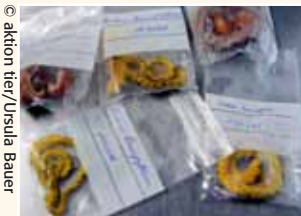
Diese Schlangen (Grüner Baumpython) haben den Schmuggel nach Deutschland nicht überlebt.

Oft verbergen sich hinter Inseraten kommerzielle Tiervermehrern aus dem In- und Ausland, die Zuchthündinnen unterschiedlicher Rassen als Gebärmaschinen halten und unglaubliche Mengen an Welpen „produzieren“.