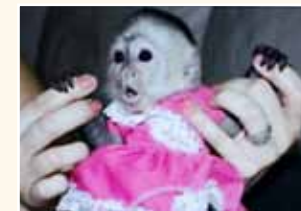
Als Püppchen verkleideter Kapuzineraffe in einer Anzeige.

Skorpionen zunehmend auch Säugetiere wie kleine Raubkatzen und Affen umfasst. Der Großteil dieser Exoten wird aus dem Herkunftsland, meist aus dem ostasiatischen, afrikanischen und amerikanischen Raum, nach Deutschland importiert. Die Lagerhaltung vor Ort ist häufig katastrophal und den Transport sollen weniger als 20% der Tiere überleben. Außerdem werden viele Exoten im Ursprungsland auf teilweise brutale Weise in der Natur gefangen (Wildfänge), was ver-