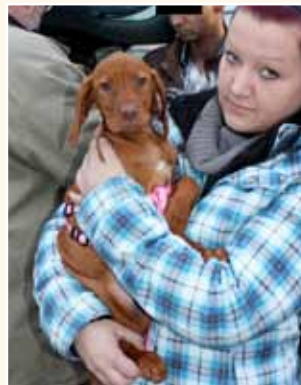
aktion tier überführt einen ungarischen Welpenhändler mit illegal importierten Hunden.

Des Weiteren benötigt jeder, der Wirbeltiere (außer Nutztiere) aus dem Ausland nach Deutschland verbringt oder importiert, um sie hier zu verkaufen oder für eine andere Gegenleistung abzugeben, eine behördliche Genehmigung. Hunde und Katzen müssen für die legale Einfuhr gechippt und gegen Tollwut geimpft sein sowie über einen gültigen EU-Heimtierpass aus dem Herkunftsland verfügen. Hundewelpen unter 15 Wochen sowie bestimmte Hunderassen, inklu-